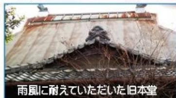
雨風に耐えていただいた旧本堂

日も掃除中、ガッちゃんと言がした。鬼瓦がずれ落 ちてきたのだ。幸い怪我人はなかった。いくら修繕 しても追いつかない。情けなくなった。多くの 方々が入りする本堂がこれではいけないと思っ た。そして、このまま修繕を繰り返すことはしては いけないのとの結論に至った。このような現状を鑑 み、将来を見据え、「今しかない」と建て替えを決 意し、平成二十五年一月、自敬寺の正月新聞で建 て替えを表明するに至ったのである。