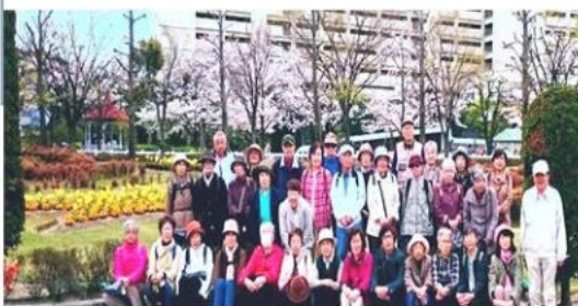
歩こう会 阪神競馬場内の花見へ