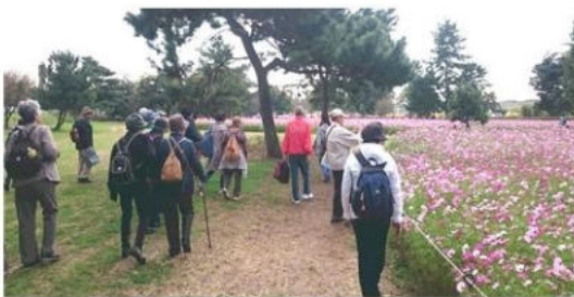
歩こう会 尼崎コスモス園へ