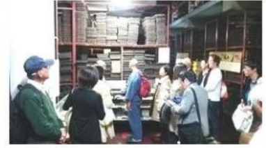
国際協力のスタッフを黄檗山にお連れして一切経の版木を見学しました