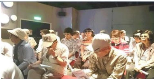
歩こう会 大阪市下水道科学館