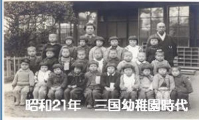
昭和21年 三国幼稚園時代