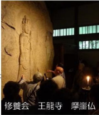
修養会 王龍寺 摩崖仏

国外の政治面では、何と云っても米国の大統領選挙で、大方の期待を裏切つてトランプ氏が当選し、又隣国のキューバではカストロ前首相が亡くなり、アメリカ大陸に新しい局面を迎えました。