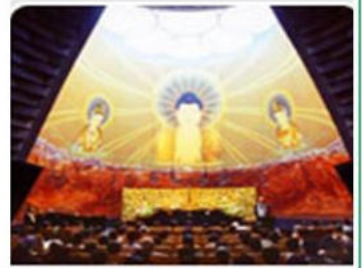
▶ 三千佛堂と千鉢佛

○写経会 ： 毎月8日 13:00~16:00の間ご自由に 1月は8日(日) からスタートです。