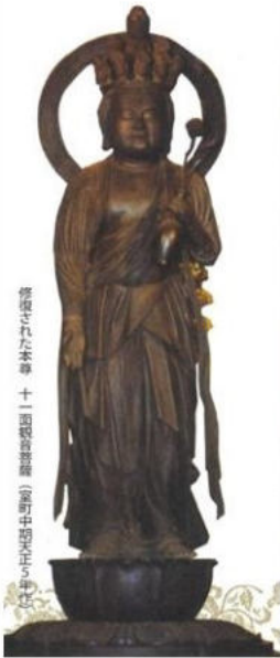
修復された本尊 十一面観音菩薩（室町中期末ごろ制作）