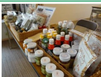
東北・熊本応援商品物販 フェアトレード商品物販