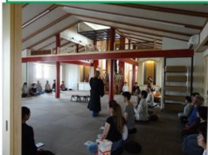
第一日曜日 坐禅会