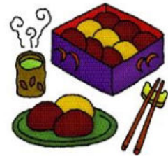
ぼたもち 春は牡丹餅 はぎ 秋はお萩