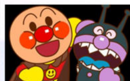
ラインスタンプより

今コロナ禍、町中マスクマン、マスクウーマンばかりです。皆ヒーロー、ヒロインばかりというわけです。現代のヒロインやヒーローは平凡に柔軟にコビット19(新型コロナウイルス)を乗り切る人だと思えます。