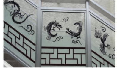
回廊階段のエッチングガラス（龍・ 鳳凰・マカラ 限定25枚）