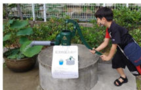
改修した井戸、平時は散水 緊急時は災害時支援井戸に