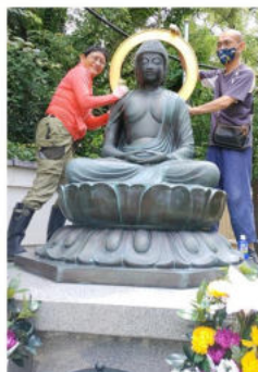
梅雨の時期に真夏に向け、銅製のお釈迦様を磨き上げます。出来ることはお寺でします。