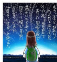
ブツダと始める 幸せの作り方 より

○入院、施設入居、手術の立会い、亡くなった時の希望も聞いておきます。認知になった後では、家族でも成年後見人になる事が難しいようです。相続の事も重要。遺言状作成のお手伝いの経験はありますが、住職は素人ですので、司法書士などの専門家に参加してもらい、ご希望に合わせて計画していくことになります。