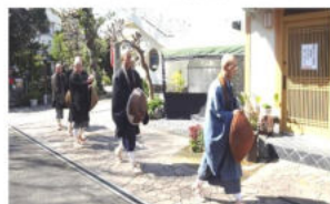
45年間続けている托鉢 来年は再開できますように