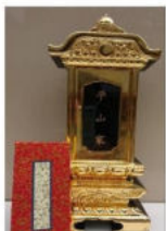
各家過去帳位牌 （限定100基）

本堂新築基金 ：もうすぐ基金目標達成率が 85% に到達します。募集は本年末で区切り といたします。銀行などからの借入金は今現在2000万円。引き続き、写経、喜舎箱、志納、位 牌・灯籠等の募集を行っております。御寄進頂いた約1,000名様のご芳名は本堂に掲載して おります。出来るだけ大勢のご賛同を得たく思っております。 1枚の写経 、ちっちゃな 貯金箱 から受け付けています。ご家族、ご親戚、ご友人、ご参加下さいますなら有難いです。 目標まで あと15% 、 よろしく お願いいたします。（詳しくはお寺まで）