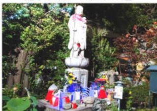
ライトアップされたお地藏様