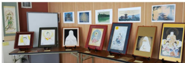
開催中の仏画展、誰にでも描けます、と皆さん言われます