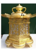
吊り灯籠（限定50基） （底面にご芳名が記されます）