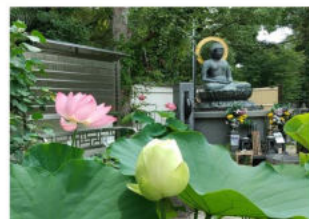
見事に咲いた紅白の蓮