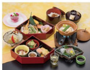
昼食イメージです