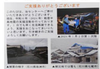
▲被災の様子(石川県津波) ▲被災地では豊も(石川県七尾市)