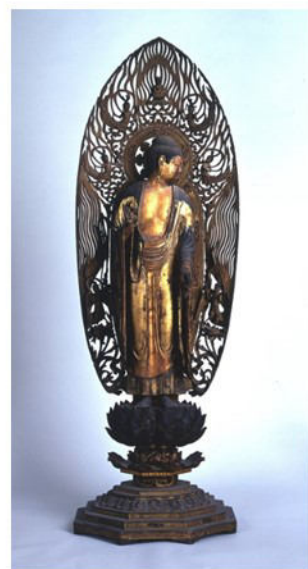
永観堂 見返り阿弥陀如来